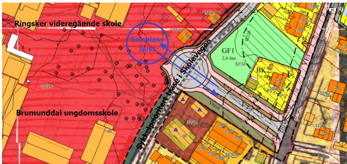
Figur 2 Alternativ løsning for skolebuss basert på eksisterende regulering

Figuren nedenfor viser mulig prinsipp for justering av gjeldende reguleringsplan dersom foreslått løsning ikke er mulig. Største svakhet med dett prinsippet er at den ikke løser problemer med hente- og bringetrafikk.