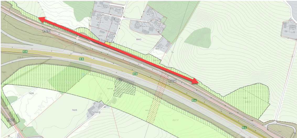
Figur 1 Viser strekningen hvor Furnesvegen er flyttes vekk fra E6 for å gi rom for støyvoll i gjeldende plan.

Bakgrunnen for endringen er at Furnesvegen er flyttet noe vekk fra E6 i gjeldende plan for å gjøre plass til støvuller. Geometrien på Furnesvegen er bra og det er ikke nødvendig å flytte Furnesvegen. Konsekvensen ved å flytte den er at man beslaglegger areal på flere eiendommer, som er unødvendig. Den samlede virkningen av tiltaket vurderes som positiv da støyforholdene bedres, og man beslaglegger mindre areal avsatt til vegformål.