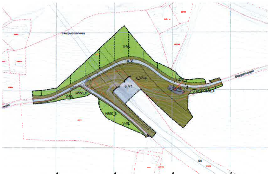
Figur 3 Nytt kartblad 8