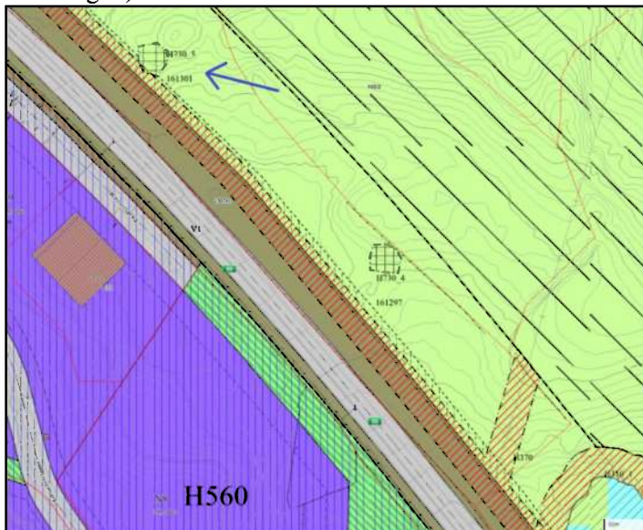
Figur 3: KulturminneID 161301-1 sør for Rudshøgda (kartutsnitt fra reguleringsplan)

Veidekke Entreprenør søker lokalitetene frigitt nå for å unngå eventuelle fremdriftsmessige konsekvenser dersom det på et senere tidspunkt i anleggsfasen blir nødvendig å søke om utvidelse av anleggsgrenser ytterligere, eller benytte hele det allerede regulerte arealet, for å få nok arbeidsplass til bygging av ny E6.