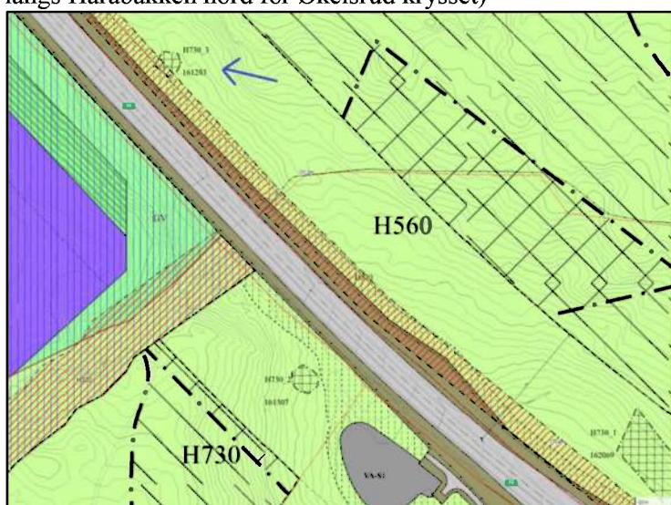
Figur 2: KulturminneID 161283-1 ved Harabakken, nord for Økelsrud krysset (kartutsnitt fra reguleringsplan)